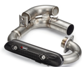
Összekötőcső, rozsdamentes acél