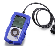
MX Power Tuner