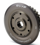
GYTR® mart belső kuplungagy

Az összes WR250F tartozék megtekintéséhez látogassa meg a honlapot vagy, kérdezze márkakereskedőjét.