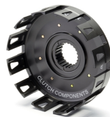
GYTR® mart kuplungosár