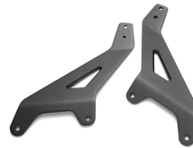
Utasháttámlára erősíthető kartámaszok, XV950