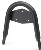
Függőleges utasháttámla, XV950