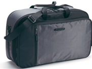
Belső táska 50 literes Touring hátsó dobozhoz, FJR