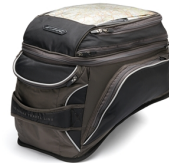
Touring tanktáska, FJR