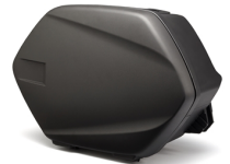
20 l-es Touring oldaldobozok

Az összes FJR1300AS tartozék megtekintéséhez látogassa meg a honlapot vagy, kérdezze márkakereskedőjét.