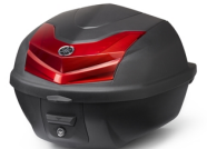
30 literes városi hátsó doboz

Az összes Neo's 4 tartozék megtekintéséhez látogassa meg a honlapot vagy, kérdezze márkakereskedőjét.