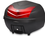
39 literes városi hátsó doboz