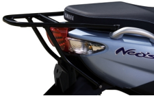
Csomagtartó rács hátsó dobozhoz, Neo's