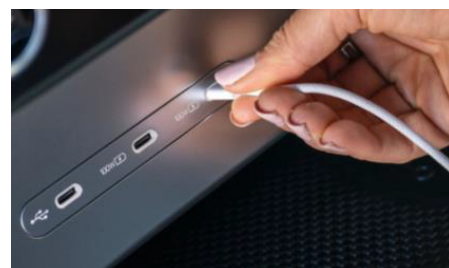
6db nagy teljesítményű USB-C csatlakozó (akár 100W)