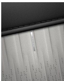
Obsidian Black & Dove Gray