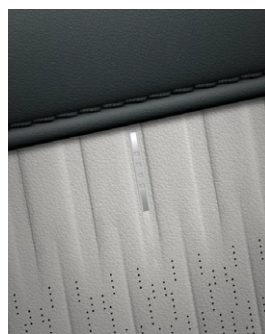
Dark Teal & Dove Gray