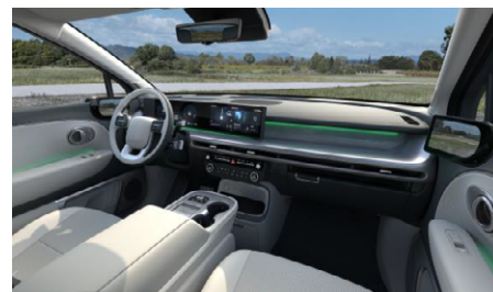
Tágas és praktikus belső tér