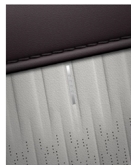
Dark Wine & Dove Gray