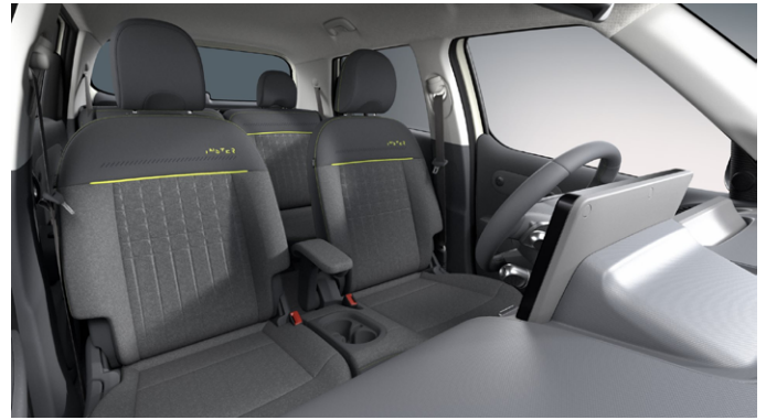
Dark Pebble Gray (Cross)