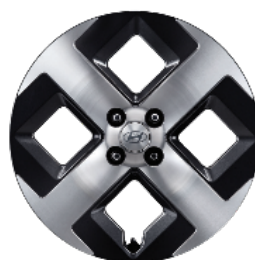
17" könnyűfém keréktárcsák Prime