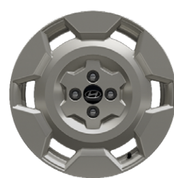
17" könnyűfém keréktárcsák INSTER Cross

Az ICCB töltőkábel nem képezi a szériafelszereltség részét.