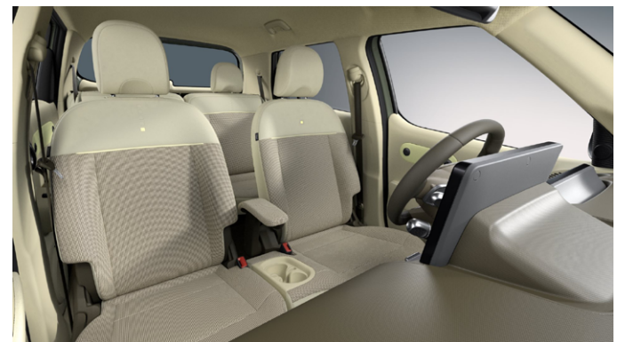
Newtro Beige + Khaki Brown (Prime)