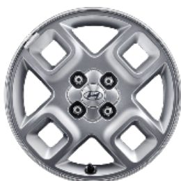
15" könnyűfém keréktárcsák Prime