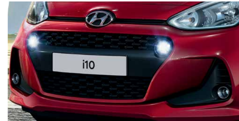
Kaszkád hűtőmaszk. Az új kaszkád hűtőmaszk kifejező kontúrjai kiemelik az i10 magabiztos személyiségét.

Az i10 jól ismert sziluettjét olyan újszerű, sportos személyiséggel ruháztuk fel, amelyet nem lehet nem észrevenni. Teljesen új a plastikusan megformált első lökhárító, amelynek díszje az új kaszkád hűtőmaszk és a látványos LED-es nappali fények. A képet új kerekek, kontrasztos hátsó lökhárítóbetét és átdolgozott hátsó helyzetjelzők teszik teljessé.