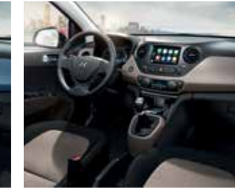
Fekete és bézs