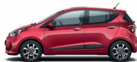
Passion Red (gyöngyházszín)