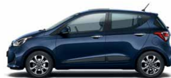
Morning Blue (alapszín)