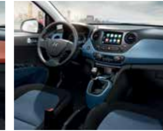
Fekete és kék