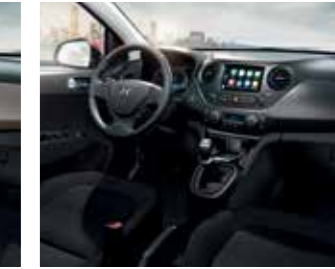
Fekete és sötétszürke