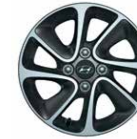
14 colos nyolcküllős könnyűfém keréktárcsa (metálszürke)