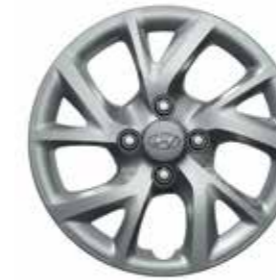
14 colos öt duplaküllős kialakítású dísztárcsa (metálszürke)