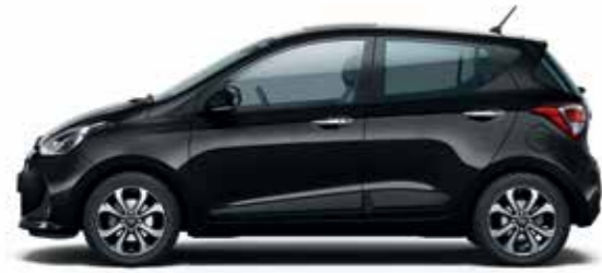
Phantom Black (gyöngyház)