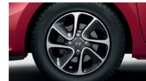
Új kerekek. Négy új kerékdizájn közül választhat; a sportos, 14 colos könnyűfém keréktárcsa még merészebbé teszi az i10 megjelenését.