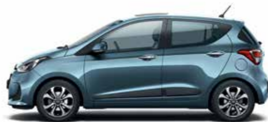
Aqua Sparkling (metálfény)