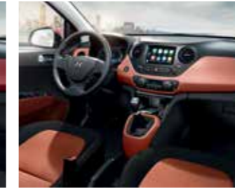
Fekete és narancs