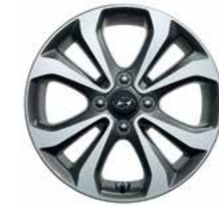
15 colos négy duplaküllős könnyűfém keréktárcsa (metálszürke)