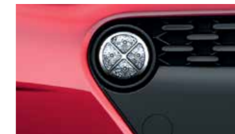
LED-es nappali világítás. Az új, kerek LED-es nappali világítás még sportosabbá teszi az i10 orrkialakítását.