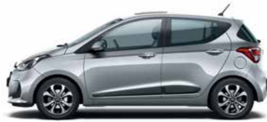
Sleek Silver (metálfény)