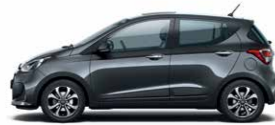
Star Dust (metálfény)