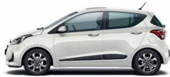
Polar White (alapszín)

Válasszon kedve szerint a karosszériaszínek, a beltéri kárpitok és a keréktárcsák kínálatából, és hozza létre a személyes ízléséhez tökéletesen illő i10-et.