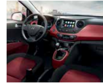
Fekete és piros