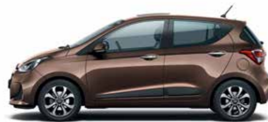
Cashmere Brown (metálfény)