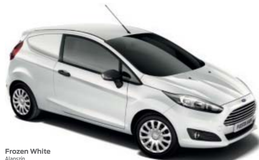
Frozen White Alapszín

Ultimate/Lux Soft Charcoal Black ülésbéprésszel Monax Soft Charcoal Black ülésoldalfelülettel