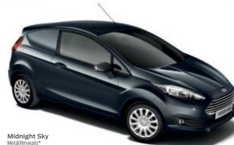
Midnight Sky Metálfényezés*