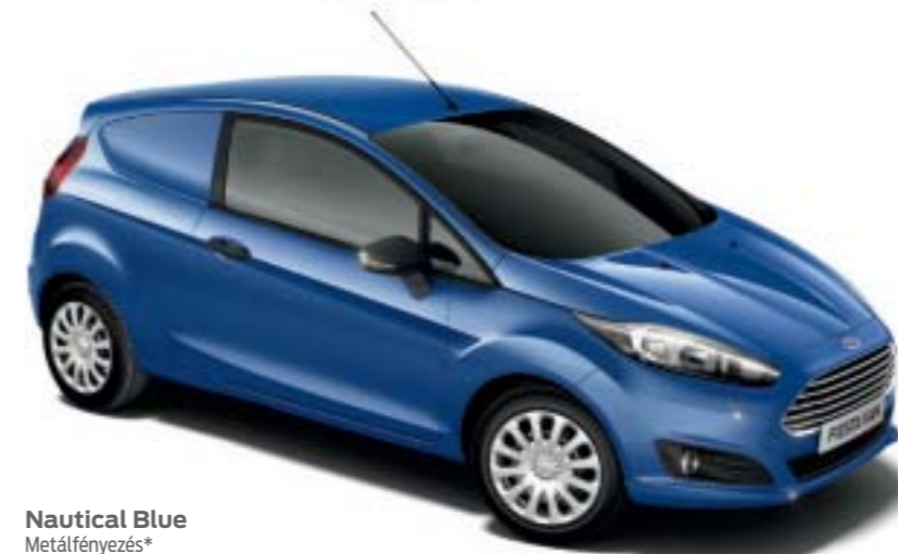
Nautical Blue Metálfényezés*