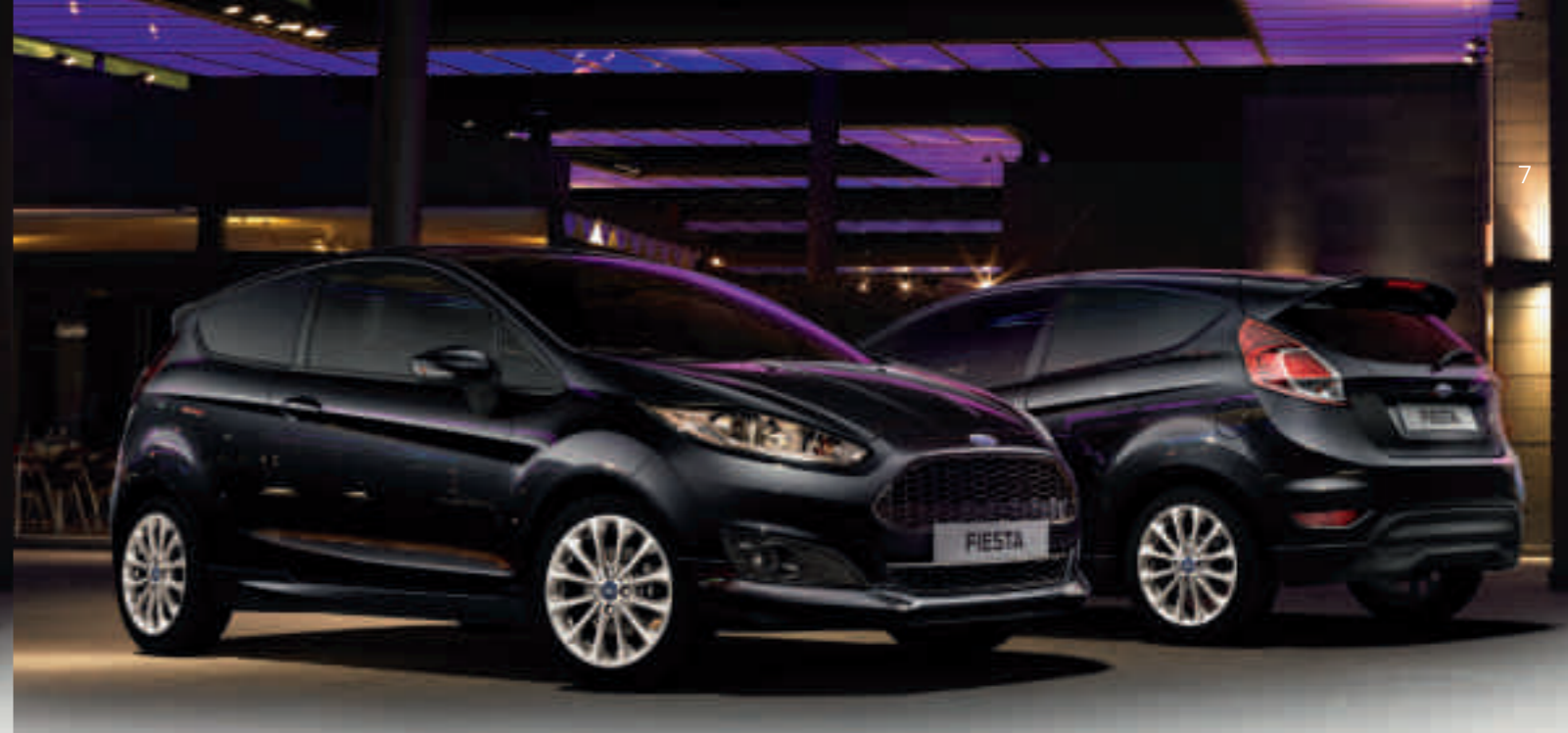
A képen látható modell egy Ford Fiesta Van Sport Panther Black fényezéssel. (Választható)

**A Ford vészhelyzeti asszisztens 2012. őszétől kapható és több mint 30 európai országban működik. A funkció akkor működik, amikor egy légzsák kiold vagy az üzemanyag-szivattyú bekapcsol, valamint ha a rendszerhez kompatibilis mobiltelefon párosítottak, amely a járműben található. További információkat a helyi Ford weboldalon tudhat meg (www.ford.hu).