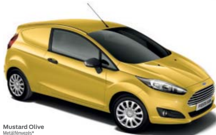
Mustard Olive Metálfényezés*