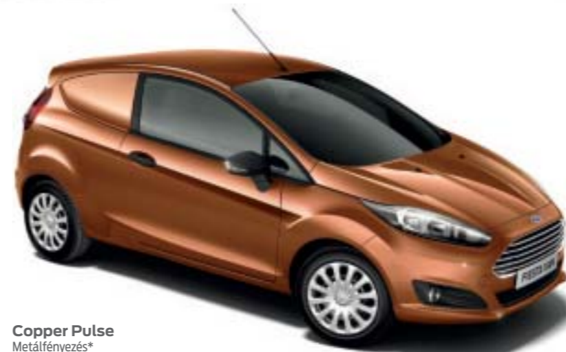
Copper Pulse Metálfényezés*