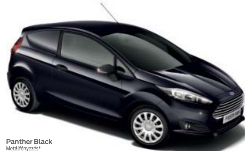
Panther Black Metálfényezés*