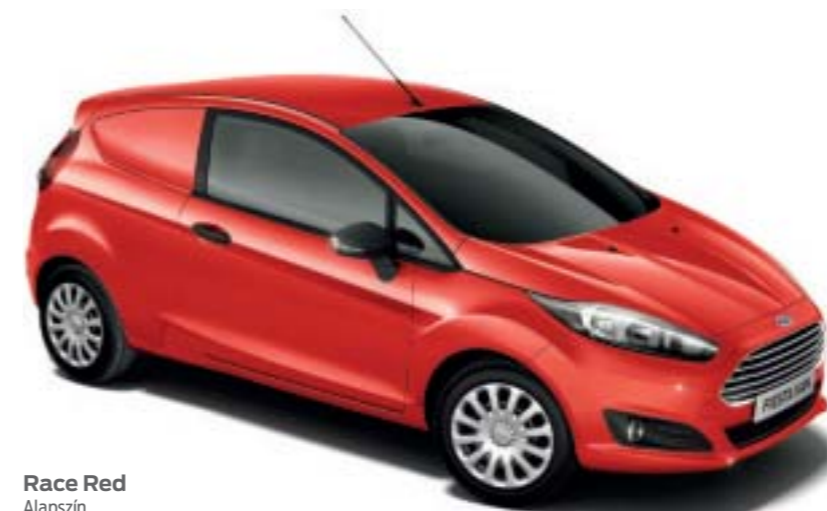
Race Red Alapszín