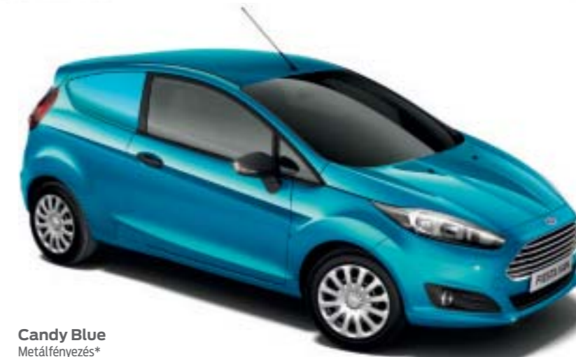
Candy Blue Metálfényezés*

*A metálfényezés feláron, választható jellemzőként rendelhető.