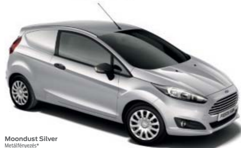
Moondust Silver Metálfényezés*