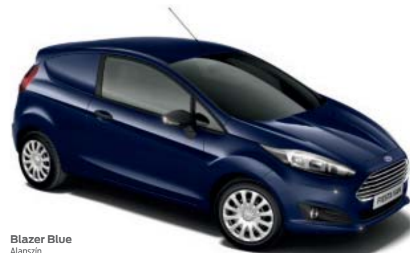
Blazer Blue Alapszín