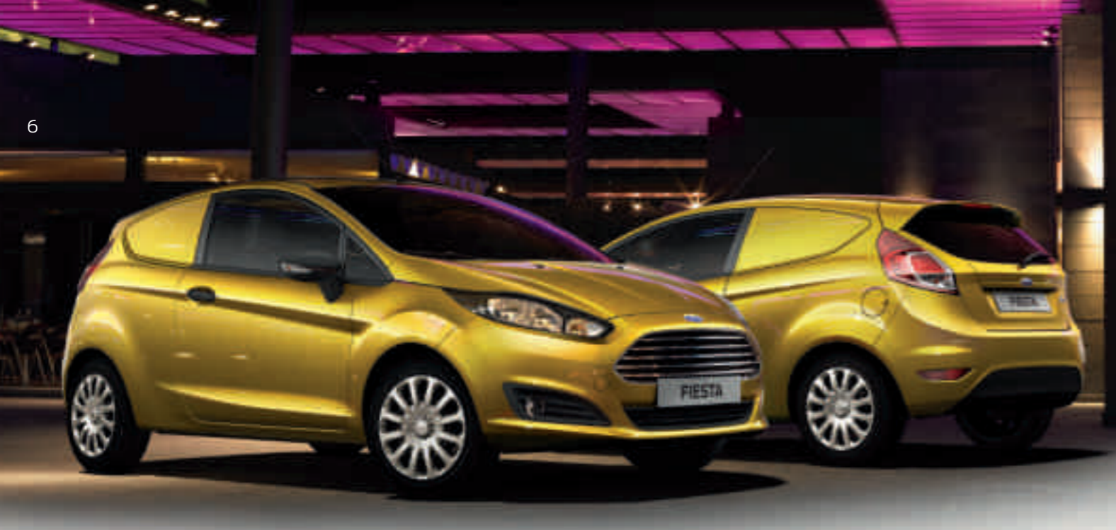
A képen látható modell egy Ford Fiesta Van Trend Mustard Olive metálfényezéssel. (Választható)