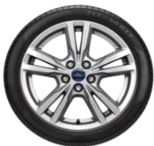
Méret 17" Széria Titanium Kategória Standard