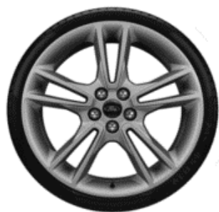
19" ST-Line Opció