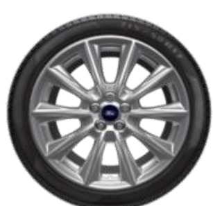
19" Vignale Opció