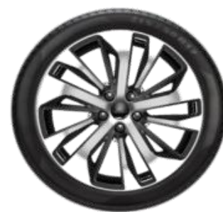
18" Titanium Opció