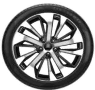
Méret 18" Széria ST-Line Kategória Standard