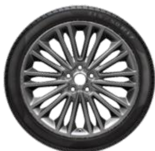
Méret 18" Széria Vignale Kategória Standard