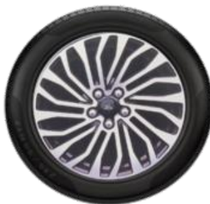
17" Titanium Opció