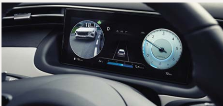
Holtterfigyelő monitor (BVM)