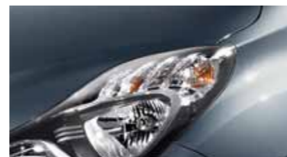
Steel Grey ZAR