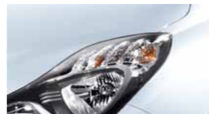
Creamy White TCW