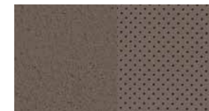
Bézs bőrkárpit STYLE esetén opció