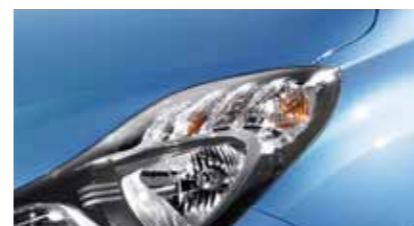
Ice Blue XAF