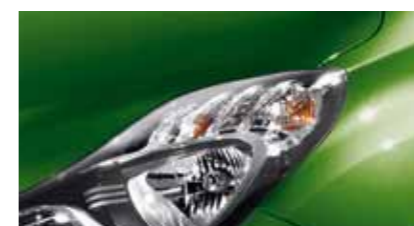
Palm Green PEG