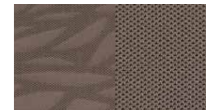
Bézs szövetszövetkárpit COMFORT/STYLE