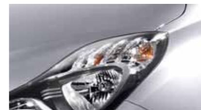
Sleek Silver RAH