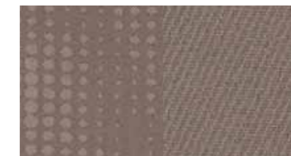
Bézs szövetszövetkárpit LIFE A/C