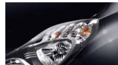
Phantom Black PAE