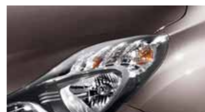
Cashmere Brown NSW