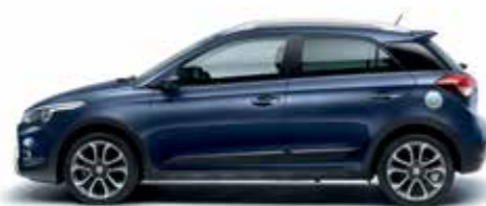
Morning Blue alapszín