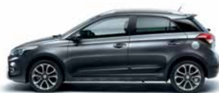
Star Dust metálszín