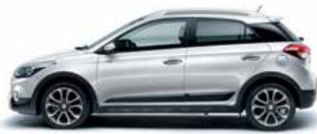
Polar White alapszín

Nincs két egyforma ember, mindenkinek egyéni elvárásai és eltérő preferenciái vannak. Az i20 Active gazdag karosszériaszín-választékának árnyalatai egytől egyig kiemelik a modell kalandvágyó természetét. Összesen négyféle belső színvilág közül választhat, valamint egy különleges opciót is kínálunk, amely Tangerine narancsszínű dekorbetétekkel gazdagítja a belső teret. Az opciós felszerelések és tartozékok kínálatából tökéletesen saját ízléséhez igazíthatja autóját. Helyi Hyundai márkakereskedője örömmel segít Önnek az igényeinek leginkább megfelelő tételek kiválasztásában.