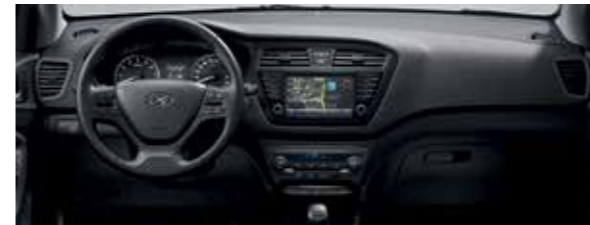
Komfort szürke beltéri színcsomag