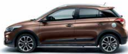
Iced Coffee metálszín