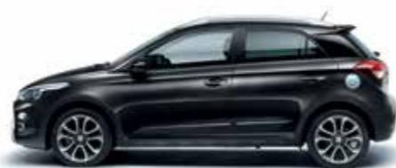
Phantom Black gyöngyház