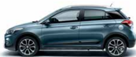
Aqua Sparkling metálszín