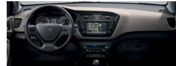
Elegáns bézs beltéri színcsomag