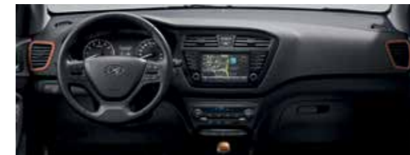
Színcsomag: narancssárga dekorelemek a beltérben