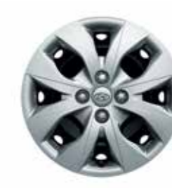
15 colos acél keréktárcsák