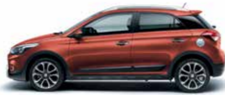
Tangerine Orange metálszín