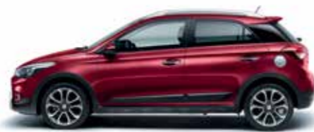
Red Passion gyöngyház