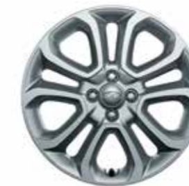
17 colos könnyűfém keréktárcsák