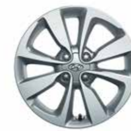
16 colos könnyűfém keréktárcsák