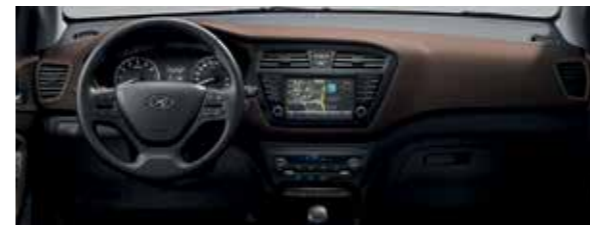
Barna beltéri színcsomag