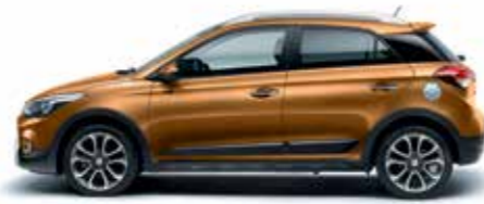
Mandarin Orange gyöngyház