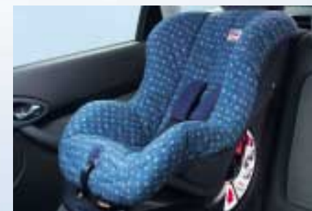
Britax biztonsági gyermekülés (Különböző méretekben. Kérjük, további információért tekintse meg az árlistát!)