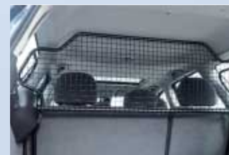
Csomagtér válaszfal, félmagas 3/5 ajtós és kombi kivitelhez (teljes magasságú kivitelben is, és leválasztóval csak a kombikhoz)