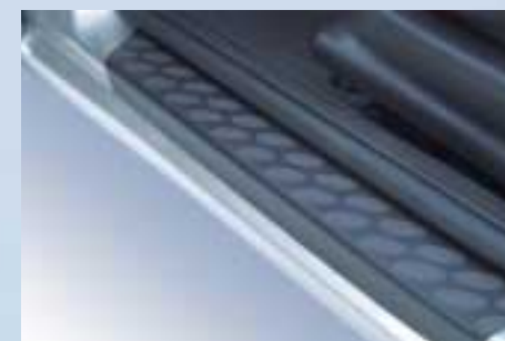
Fekete küszöbvédő fólia – az öntapadó kivitel könnyű felszerelést biztosít.