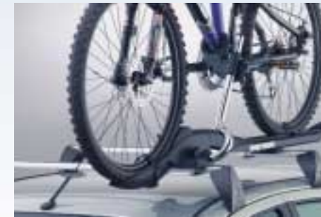
Mont Blanc "Barracuda" kerékpár szállító tartozék (Más tetőtartó tartozékok is rendelkezésre állnak. Kérjük, tekintse meg az árlistát!)