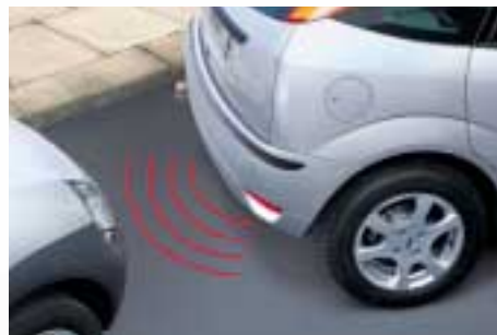
Pakolássegítő távolság-érzékelők 3/4/5 ajtós és kombi kivitelhez (vonóhorog nélküli kivitelhez)