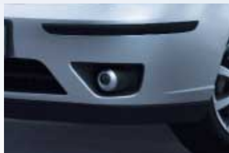
Első ködlámpák ST170 (DE-vetítési technológia)