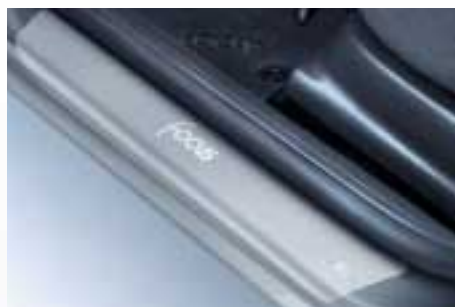
Alumínium bevonatú, karcolásmentes felületű koptatólemezek (titánszürke színben is)