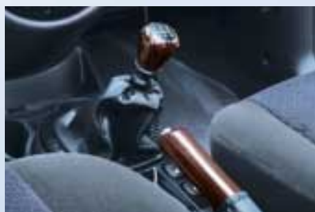
Váltókar gomb és kézifék markolat sötét Curl-paduak fa színben (Cordus fa színben is)