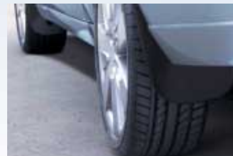
Illeszkedő sárfogó gumi