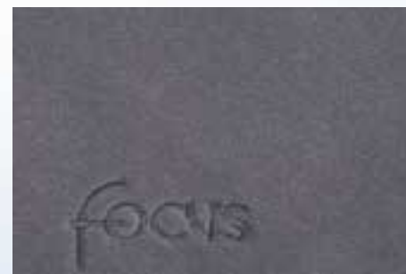
Szőnyegek – jó minőségű velúr, 3/4/5 ajtós és kombi autókhoz (különböző színekben és kivitelben, az Ön FordFocus-ának belsejéhez illeszkedve)