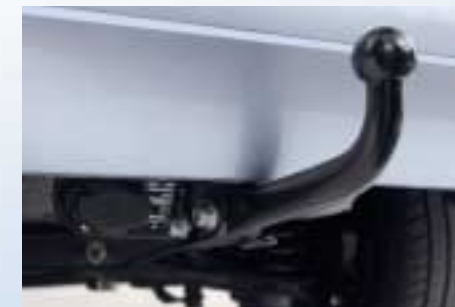
Rögzített vonóhorog elektromos készlettel (leszerelhető kivitelben is kapható, de parkolássegítő rendszerhez ill. kiegészítő karosszéria csomaghoz nem alkalmazható)