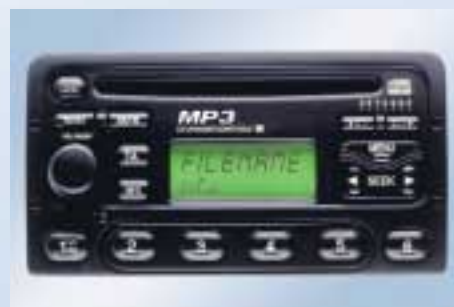
MP3 audio rendszer, CD-lejátszóval és RDS/EON-os AM/FM rádióval

További részletekért érdeklődjön Ford márkakereskedőjénél.