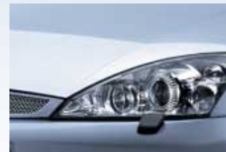
Levehető, átlátszó, köfelverődés elleni védelmet nyújtó fólia (A képen a láthatóság miatt kiemelve ábráztuk.)