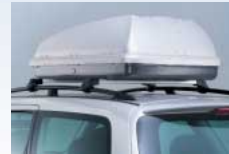
Thule tetődoboz (Különböző méretekben. Kérjük, tekintse meg az árlistát!)