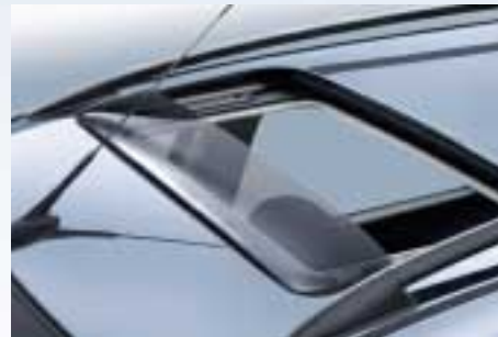
A ClimAir színezett akril-üveg tetőablak légterelő csökkenti a szélzajt és a huzatot.