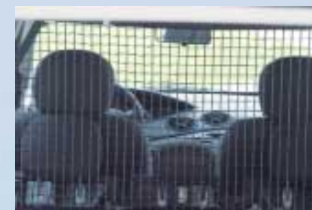
Csomagtér elválasztó háló, csak kombihoz (az első és a hátsó ülések mögé lehet szerelni)

További részletekért érdeklődjön Ford márkakereskedőjénél.