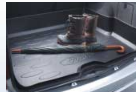
Csomagtér burkolat (csak a kombi kivitelhez)