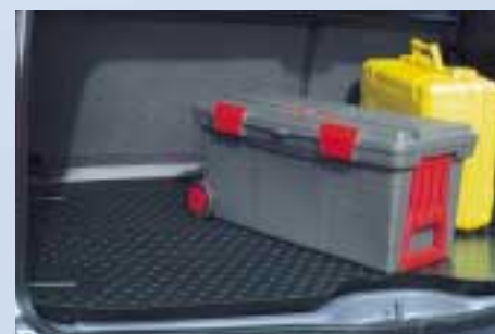
Csúszásgátló szőnyeg (3/4/5 ajtós és kombi kivitelhez)