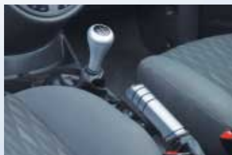
Váltókar gomb és kézifék markolat alumínium hatású színben (titánszürke színben is)