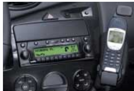
Rádiótelefon előkészítő csomag, mely különböző gyártmányú rádiótelefonokhoz rendelhető (Kérjük, további információért tekintse meg az árlistát!)