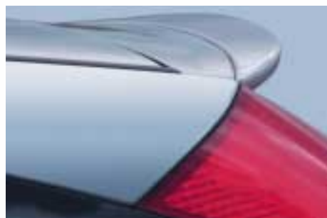
Hátsó spoiler (3/5 ajtós és kombi kivitelhez)