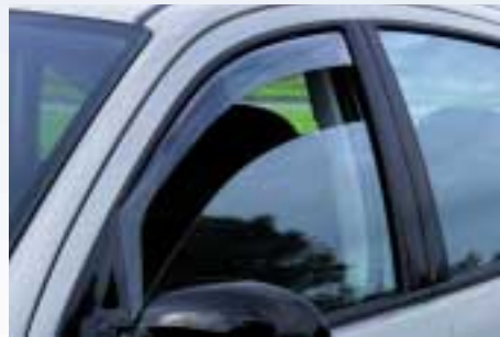
ClimAir színezett akril-üveg oldalablak légterelő