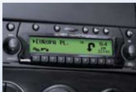
Becker "Traffic Pro" navigációs rendszer rádióval, CD-lejátszóval és navigációs rendszerrel